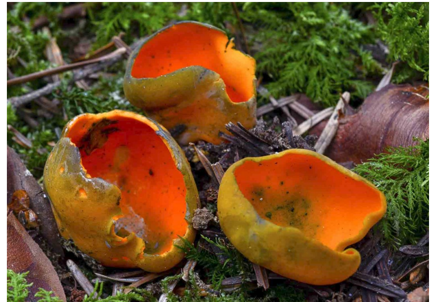
Calocypha fulgens

Société Mycologique et Botanique de la Région Chambérienne Maison des associations - Boîte U 10 - rue Saint-François-de-Sales - 73 000 Chambéry Site Internet : https://www.smbrc-chambery.fr/