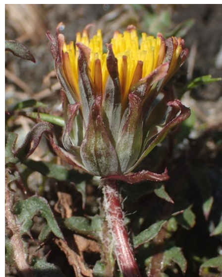
Taraxacum magnoliolum

Jeudi 29 - sortie journée Mycologie des forêts d'altitude du Beaufortain avec M. Durand, (départ 8h, parking relais de La Trousse à La Ravoire).