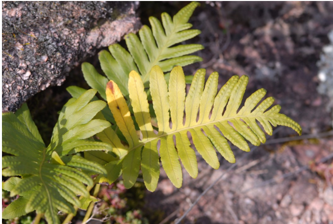
Polypodium cambricum

N.B. Le lieu des balades peut être modifié en fonction des poussées de champignons et des floraisons de plantes. D'autres sorties seront programmées lors des séances de détermination les lundis soir. Pensez à consulter régulièrement le site Internet de l'association :